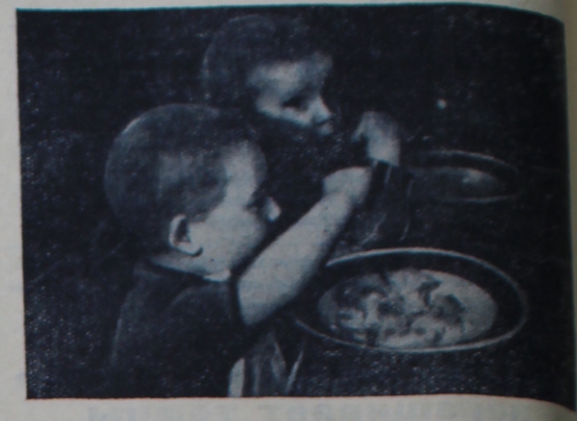
На аппетит не жалуются