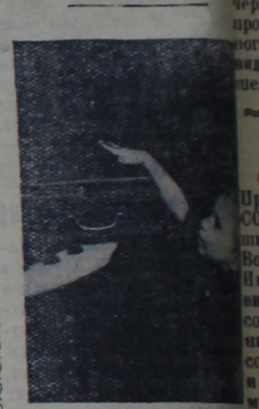
«Интересно, что там там