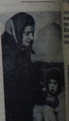
«Не хочу домой!...