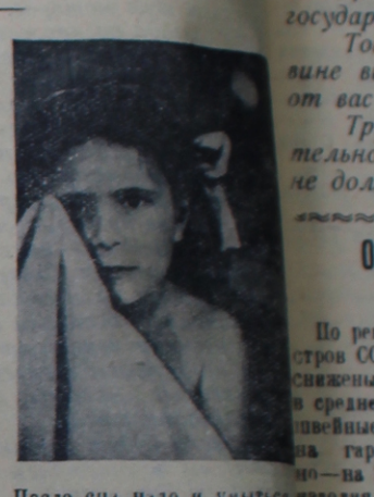
После сна надо и умыться

Просьба к подписчикам газеты дооформить подписку.